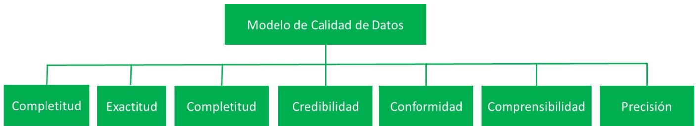
Figura 2. Modelo de Calidad de Datos Resultante (elaboración propia)