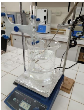
Figura 1. Sistema para la medición de \eta : viscosímetro Ubbelohde 1C en baño de agua. Resultados

El uso del viscosímetro se hizo bajo los lineamientos de la norma ASTM D 446-04. Se emplearon dos PLA comerciales, cloroformo como solvente y temperaturas de trabajo de 25°C y 30°C. Se prepararon 7 soluciones de PLA de concentraciones ( c_i ) 0,0; 0,1; 0,3; 0,5; 0,7; 1,0 y 2,0 g/dl según lo recomendado por Peñaranda et al. (2016). Nótese que se observó dificultad en la disolución del PLA 2500 HP posiblemente debido a su mayor grado de cristalinidad. El viscosímetro y las soluciones se llevaron a la temperatura de trabajo durante al menos 30 minutos (Fig. 1) antes de efectuar las mediciones en orden creciente de concentración. El viscosímetro se cargó con la solución y se cronometró el tiempo de elución ( t_i ). Cada medición se realizó cinco veces y se calculó el valor promedio ( \bar{t}_i ).