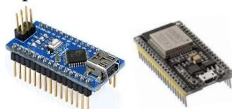
Fig. 2. Arduino nano y Esp 32, (base tecnológica para Cansat)

Es un sistema del tamaño de una lata de bebida gaseosa cuya misión puede ser recoger datos, efectuar retornos controlados o cumplir algún perfil de misión predeterminado.